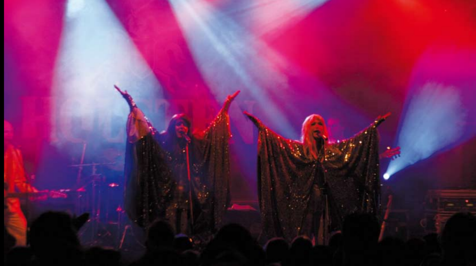
Alstervergnügen 2007, Hamburg – „Waterloo“

Kreative Beleuchtungs- und Beschallungskonzepte