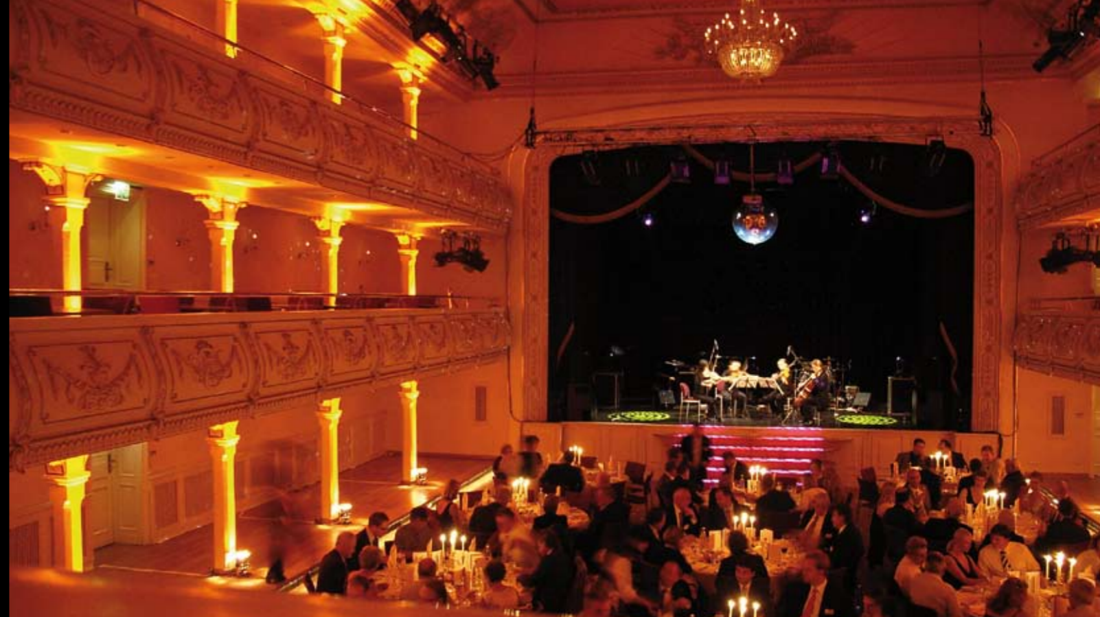
Tagung der Dt. Bauchemie e.V., 2007, Kaisersaal, Erfurt

Enge Abstimmung zwischen Auftraggebern und Gewerken. Souveräne Durchführung. Vor- und Nachbereitung. Pressearbeit. Veranstaltungen von 2 - 2000 Personen.