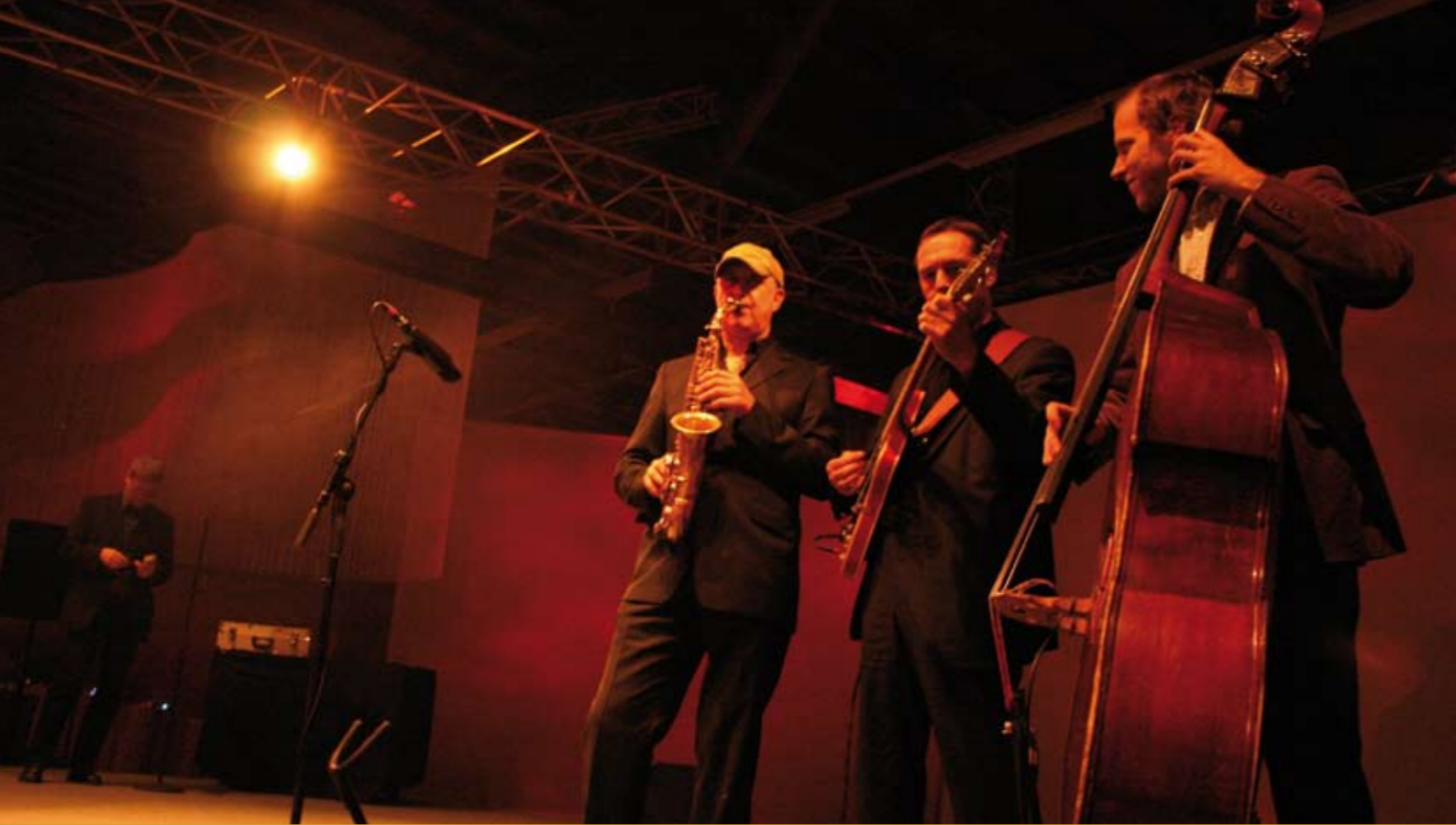
50 Jahre Coloplast „Together“, 2007 Schuppen 52, Hamburg