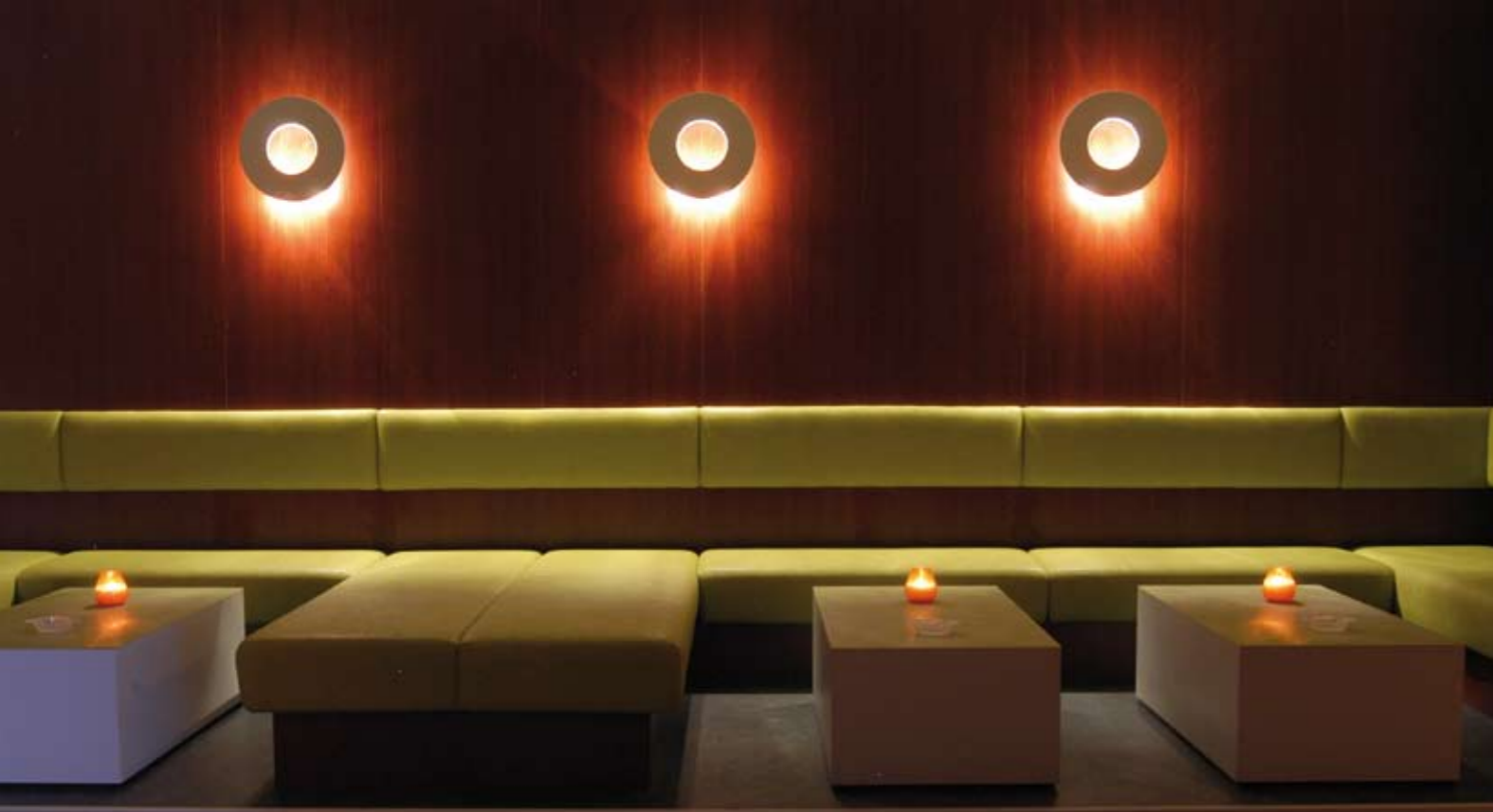
„Green Lounge“, Edelfettwerk, Hamburg